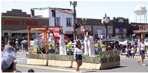
Miss Toppenish Float in the Wild West Parade Watch parade coverage on MidValleyTV.com