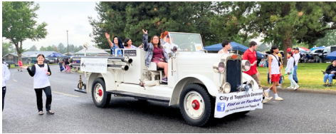
La bombera Ol' Susie de Toppenish en el desfile del Día del Tratado