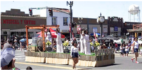
La carroza de Miss Toppenish en el desfile del Viejo Oeste Mira la cobertura del desfile en MidValleyTV.com