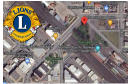
Mapa de la Ruta del Desfile Desayuno en la ubicación