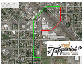
Parade Route Map

The event is set to take place at Railroad Park, located at 10 East Asotin Avenue. Find yourself some flapjacks and then catch the Wild West Parade at 11 am as it goes through downtown Toppenish. For more details, visit visittoppenish.com .